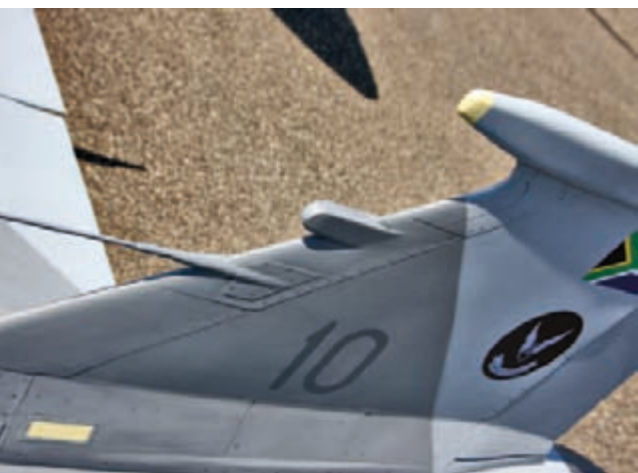
Scale-Details wie die UHF- und ILS-Antenne am Seitenleitwerk unterstützen den starken Eindruck des Modells.