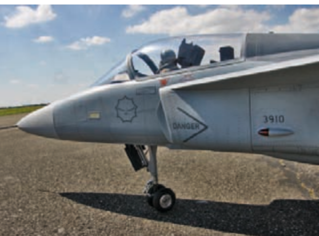
Lackiert wurde die Gripen mit Basislack und reichlich verdünntem mattem Klarlack, die Decals erstellte Ralf Schneider (tailormadedecals).

des Rumpfrückens und die Strakes angefertigt. Weiterhin wurde das Seitenleitwerk mit der UHF- und der ILS-Antenne ausgestattet.