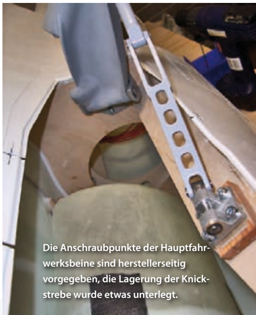
Die Anschraubpunkte der Hauptfahrwerksbeine sind herstellerseitig vorgegeben, die Lagerung der Knickstrebe wurde etwas unterlegt.

Im eingefahrenem Zustand sorgt ein Anschlag für die korrekte Fahrwerksposition.