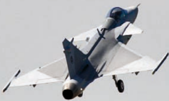
Nach dem Abheben geht's kraftvoll nach oben – die JetCat P 200 ist für das Modell der optimale Antrieb.

Am nächsten Tag fand ich zu meinem Erstaunen einen kleinen Ölsee im Modell. Glücklicherweise hatte sich der Großteil