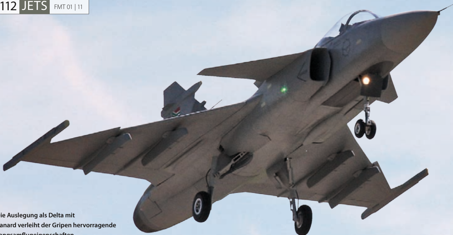
Die Auslegung als Delta mit Canard verleiht der Gripen hervorragende Langsamflugeigenschaften.