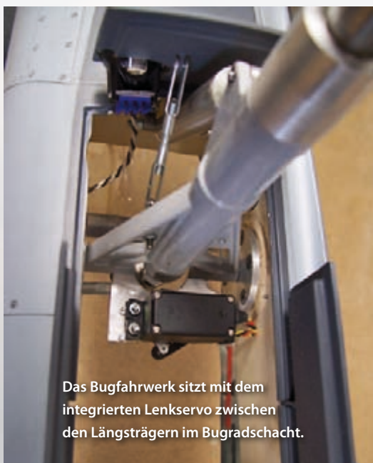
Das Bugfahrwerk sitzt mit dem integrierten Lenkservo zwischen den Längsträgern im Bugradschacht.

bereits entlüftete Schläuche anschließt, minimiert den späteren Ärger mit Luftblasen, die bekanntlich Gift für ein gut funktionierendes System sind. Folgende Vorgehensweise hierzu hat sich bei mir bewährt: Das Aggregat wird hochkant im Rumpf verbaut, damit sich die nach oben steigende Luft im Bereich der Tankentlüftung sammeln kann. Das 4/2-Wege-Ventil mit Betätigungsservo wird auf einem benachbarten Brettchen installiert. Hierfür eignete sich die Ausbuchtung auf der Rumpfunterseite, die das Bordgeschütz darstellt, hervorragend. Anschließend habe ich die komplette Verschlauchung mit 4-mm-PUN-Schlauch zu den drei Fahrwerkszylindern verlegt und ein paar wenige Zentimeter hinzu gegeben. Statt die Hydraulikzylinder anzuschließen, habe ich nun die Leitungen mit Festo-Verbindern „kurzgeschlossen“.