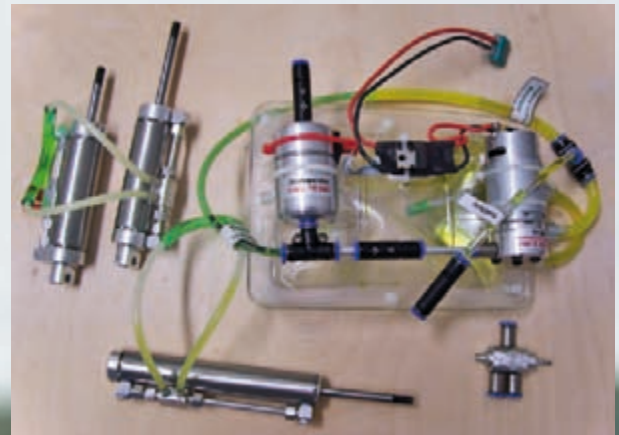
Systemdarstellung der Hydraulikanlage

Das Hydraulik-Set besteht aus Druckspeicher, Pumpe, Elektronik und drei Zylindern.